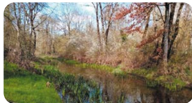
> La Frayère à Jazeneuil