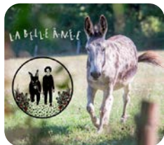
> La Belle Ânée, randonnées et activités avec des ânes et des lamas.